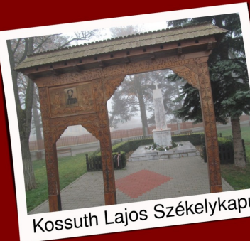
Kossuth Lajos Székelykapu