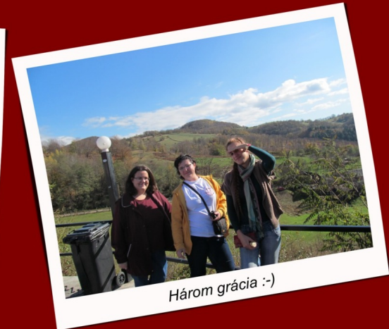
Három grácia :-)