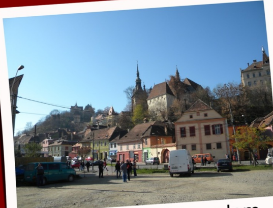
A segesvári vártemplom messziről és ...