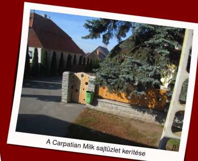
A Carpatian Milk sajútület kertése