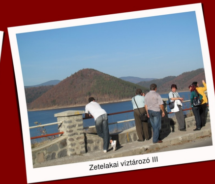
Zetelakai víztározó III