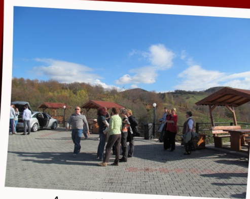
A csapat lassan továbbindul