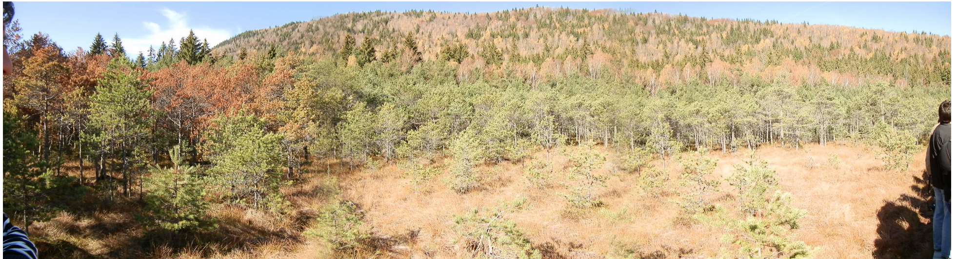
Sudár Anita panorámaképei