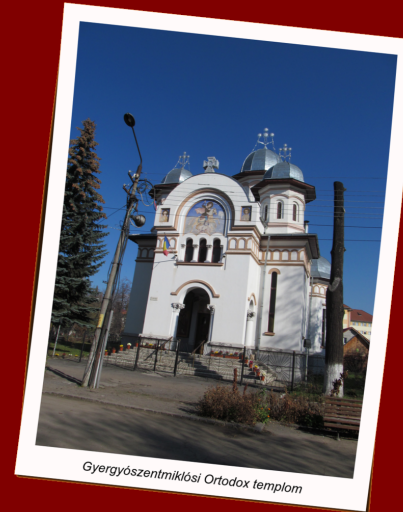
Gyergyószentmiklósi Ortodox templom