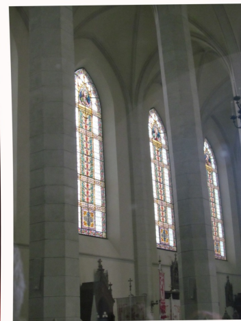
A templom belülről