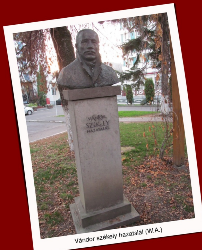
Vándor székely hazatalál (W.A.)