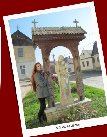
Máriák és Jézus