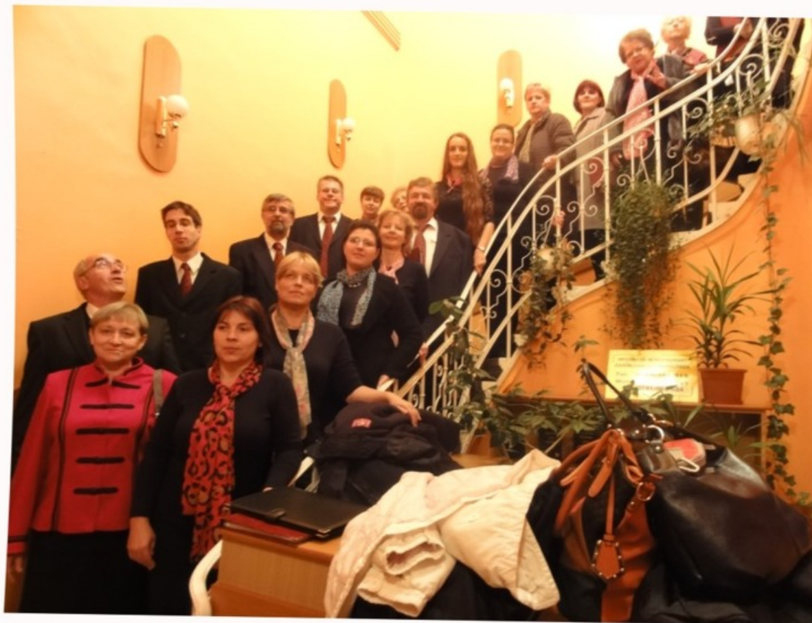
A Szilágyi Hotel lépcsőjén