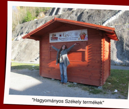
"Hagyományos Székely termékek"