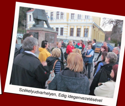
Székelyudvarhelyen, Edig idegenvezetésével