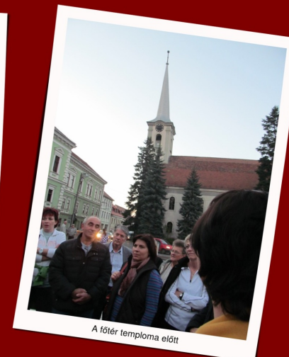
A főter temploma előtt