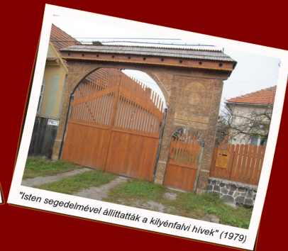
"Isten segedelmével állították a kilyénfalvi hívek" (1979)