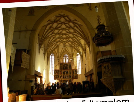
A berethalmi erődtemplom