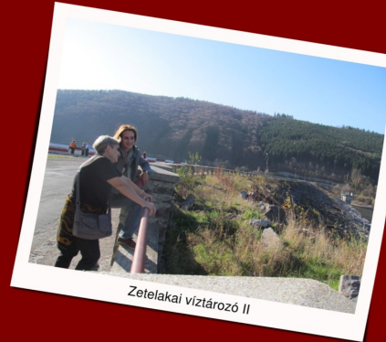
Zetelakai víztározó II