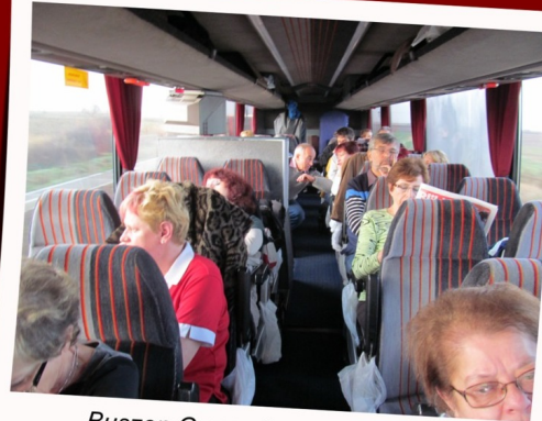
Buszon Gyergyószentmiklós felé

Estefele érkeztünk meg Gyergyószentmiklóstra, ahol a szállásunk a belvárosi Szilágyi Hotel volt. Vendéglátó kórusunk a gyergyószentmiklósi Szent Miklós Kamarakórus már tárt karokkal és teli kancsókkal várt minket. Nagy viszontlátás volt, egy rövidebb összejövetel, majd vacsora következett. Hiába a 12 órás út kifárasztotta kórusunk tagjait, így egy kiadós vacsora után aludni tértünk.