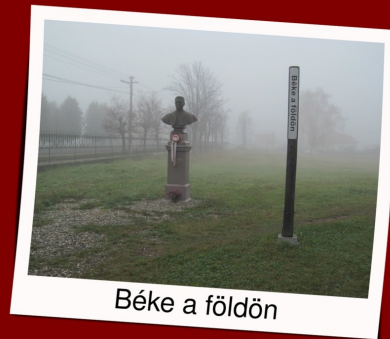
Béke a földön