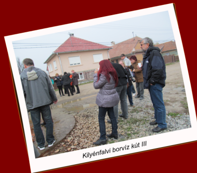
Kilyénfalvi borviz kút III