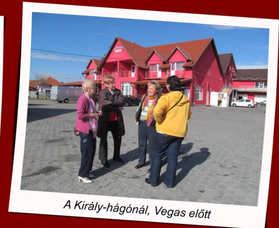
A Király-hágónál, Vegas előtt