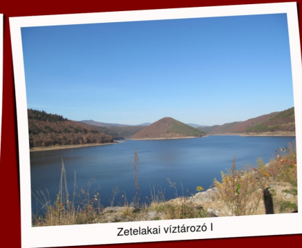
Zetelakai víztározó I