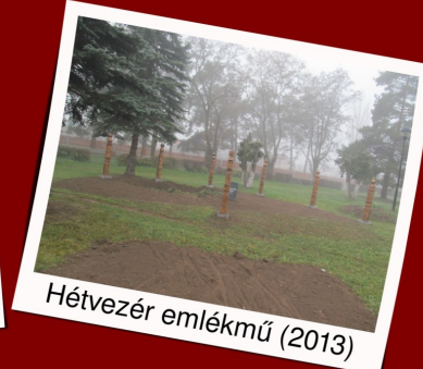
Hétvezér emlékmű (2013)