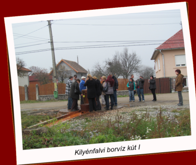
Kilyénfalvi borviz kút I

egyét a belvárosban, ráleltünk a helyi ortodox templomra, egy magyar gimnáziumra, a városházára és sétánk végével egy boltba betérve még Pöttyös Túró Rudit is láttunk.