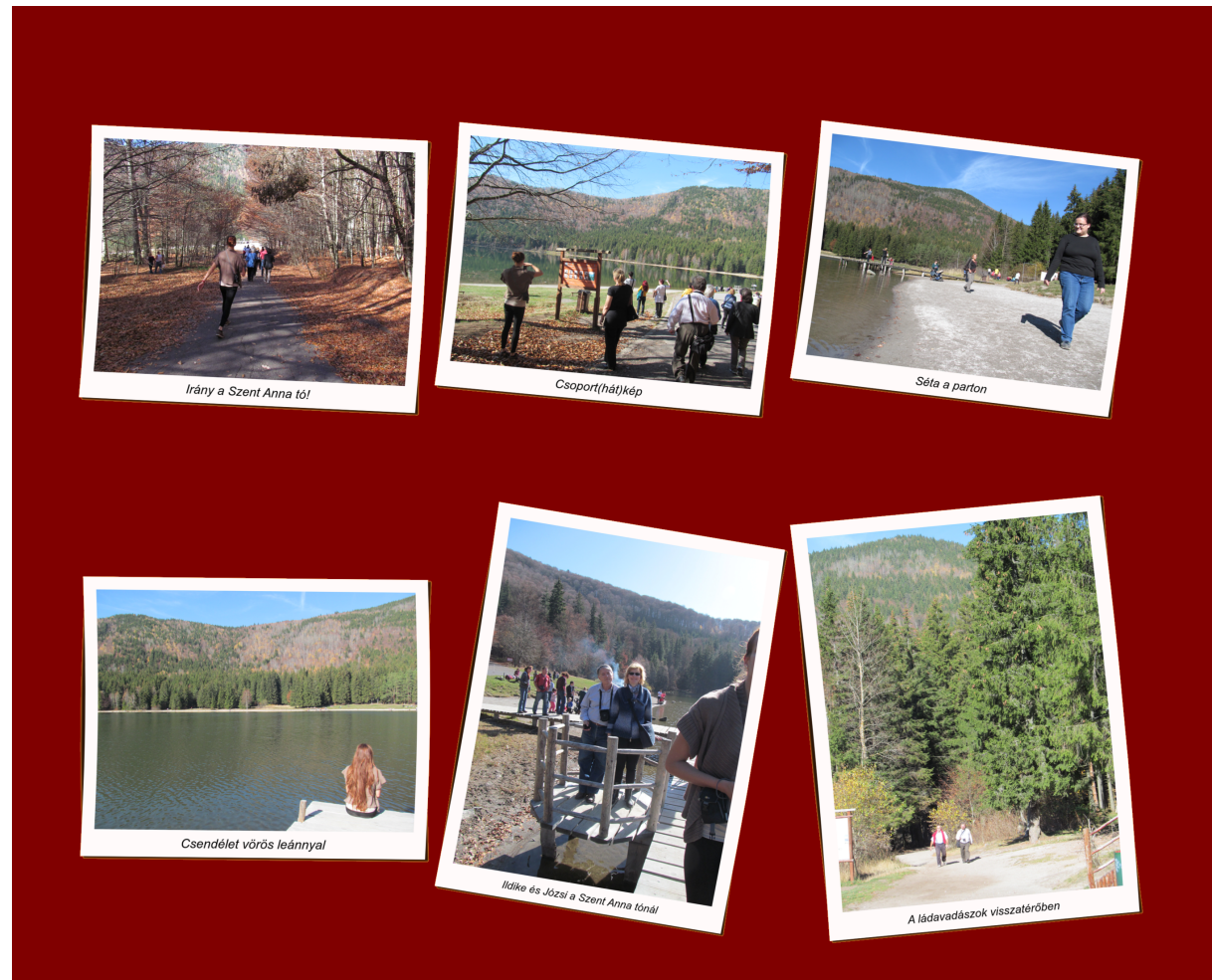
Irány a Szent Anna tó!

A tóban ki a szemét, ki a kezét mosta meg, de személy szerint én nem láttam senkit közülünk, aki derékig merítkezett volna. A tó túloldalán viszont elég sok bűnöst láttunk (aka fürdőzők).