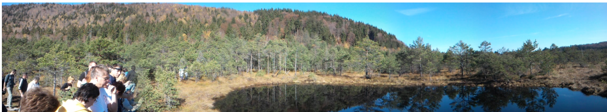
Csüllög Imre panorámaképei