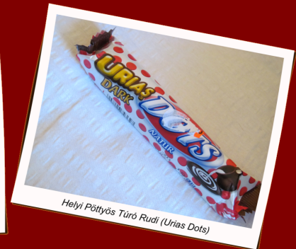
Helyi Pöttyös Túró Rudi (Urias Dots)

A kisebb pihenő után próbáltunk, 19 órakor pedig felléptünk a Szent Miklós templomban 2 (a Szent Miklós Kamarakórusral).