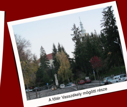
A főter Vasszékely mögötti része