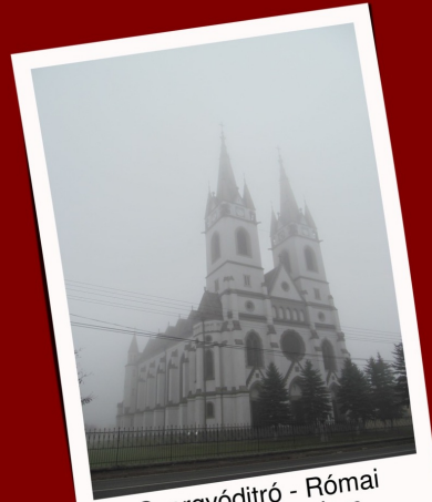
Gyergyóditró - Római katolikus templom

Második napon kipihelve útnak is indultunk, Bajna Gyuri „bácsi” ismét kísérőként szegődött hozzánk, hogy segítségével újabb helyeit fedezhessük fel a környéknek. Reggeli után Gyergyóditró felé vettük az irányt, ahol elsőként egy friss (2013-ban avatott) hétvezér emlékművet néztünk meg, illetve az ezzel szemben álló neogótikus Jézus Szent szíve-templomot, melynek ablakai a tizenkét apostolt ábrázolják színes üvegbetétekkel. 1 A tornyok magassága 76 méter, bár a nagy köd miatt a tornyok tetejét alig lehetett látni. A hétvezér emlékmű mellett egy Kossuth Lajos képét ábrázoló székelykapu mögött megtekintettünk egy háborús emlékművet is, illetve a túloldalon egy eredetileg román emlékművet, amit 1989-ban a magyarok újrahasznosították, elhelyezve rajta a „Szabadság” feliratot.