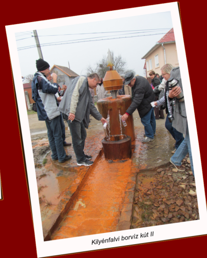
Kilyénfalvi borviz kút II